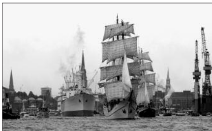
818. Hafengeburtstag Hamburg vom 11. bis 13. Mai 2007