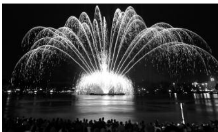
Programm-Highlights vom 31. Alstervergnügen Hamburg